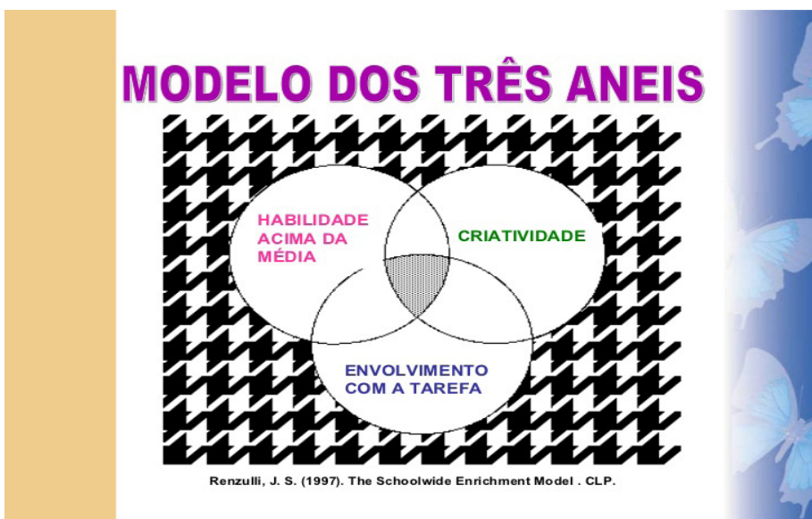
FIGURA 1 – MODELO DOS TRÊS ANEIS