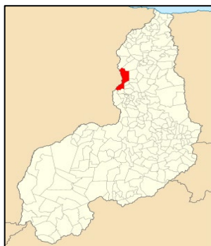
Localização de Teresina no Estado do Piauí.

Nesse sentido, a cidade apresenta-se como uma área de influência para os Estados do Pará, do Maranhão, Tocantins e Ceará. É também a cidade que possui a melhor equidistância rodoviária entre todas as capitais nordestinas, o que favorece as mais diversificadas atividades econômicas em todos os setores.